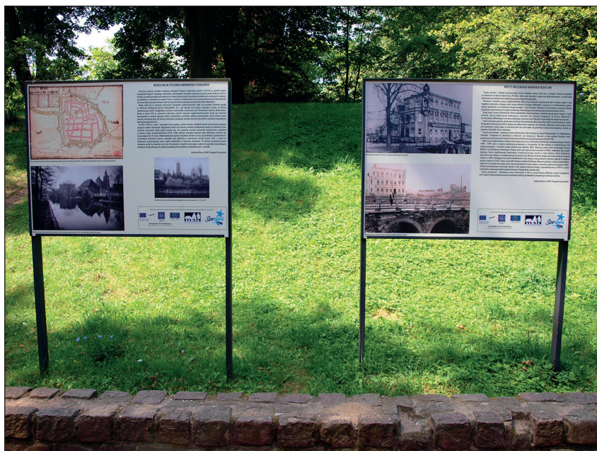
Ryc. 11. Fragment wystawy Stargard – miasto nad Iną eksponowanej w parku Bolesława Chrobrego od lipca do października 2014 r.