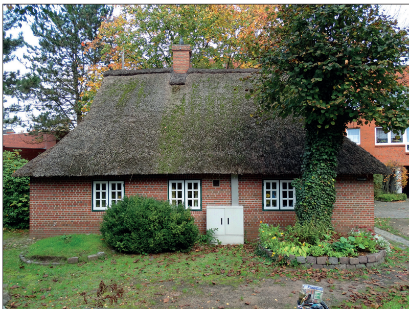
Ryc. 13. Budynek Heimathaus Stargard przy Mittelweg 41 w Elmshorn, 15 października 2014 r.