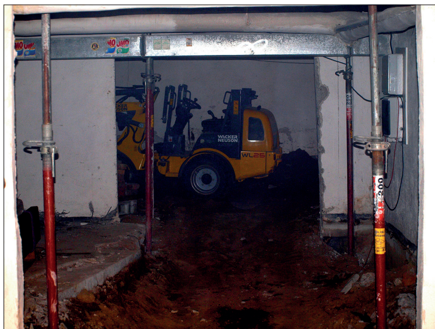
Ryc. 8. Prace remontowo-adaptacyjne wewnątrz magazynu zabytków archeologicznych MAH w Stargardzie, wg stanu z 12 listopada 2014 r.