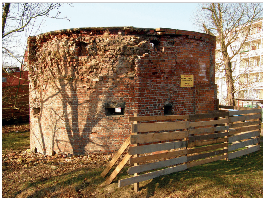
Ryc. 2. Basteja przy ul. Strażniczej/Kazimierza Wielkiego w Stargardzie, wg stanu z 11 marca 2014 r.