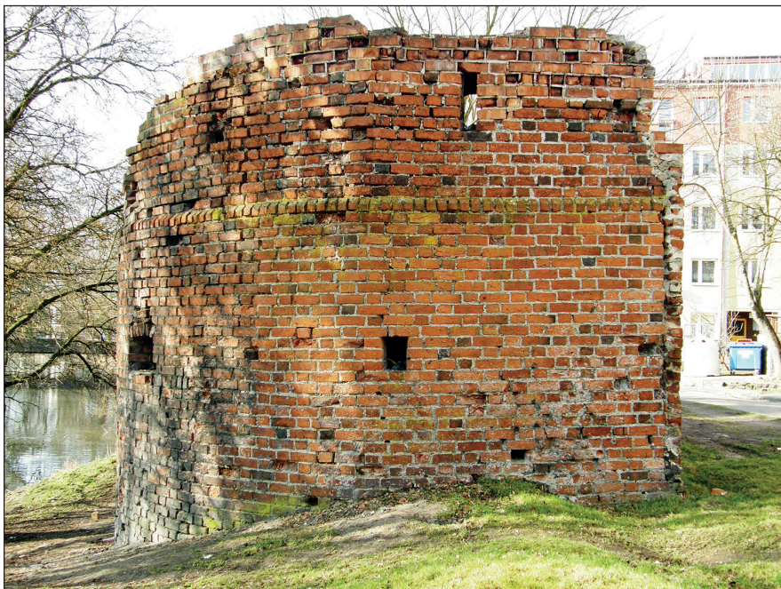
Ryc. 1. Basteja przy ul. Strażniczej w Stargardzie, wg stanu z 11 marca 2014 r.