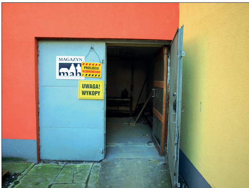
Ryc. 7. Wejście do magazynu zabytków archeologicznych MAH w Stargardzie w trakcie prac remontowo-adaptacyjnych, wg stanu z 30 października 2014 r.