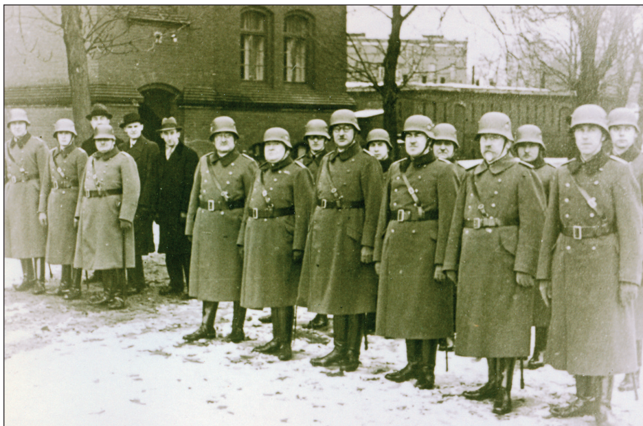
Ryc. 14. Niemieccy żołnierze na terenie „Czerwonych Koszar” w Stargardzie, około 1934 r.