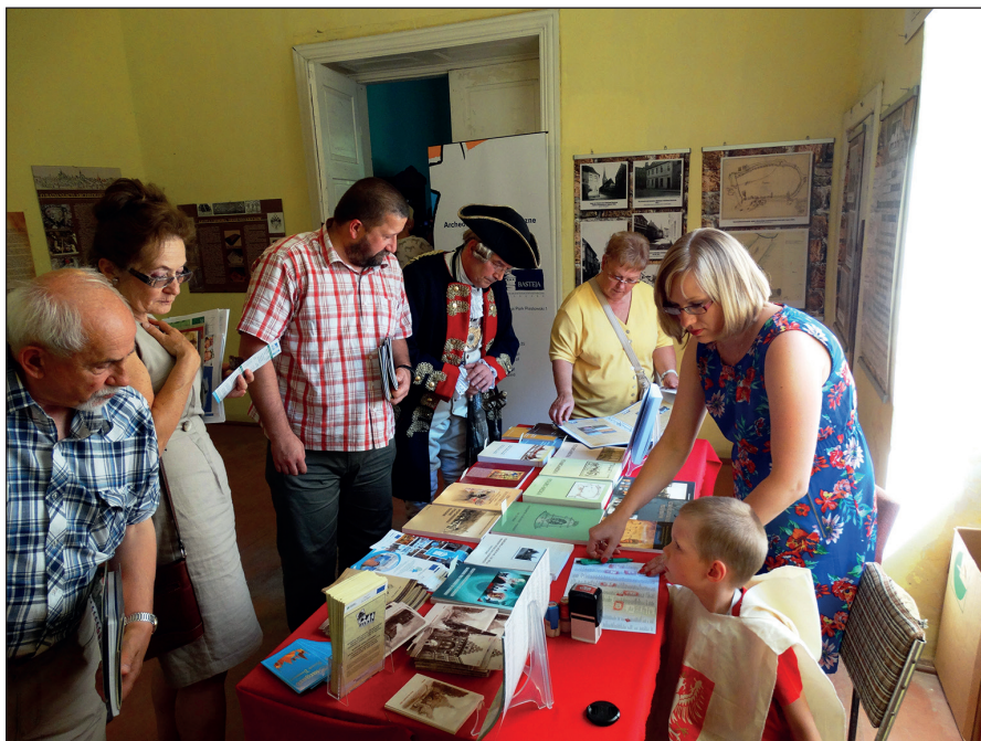
Ryc. 12. „XI Henrykowskie Dni w Siemczynie” (4-6 lipca 2014 r.), sala we wnętrzu barkowego pałacu, w której prezentowany był dorobek wystawienniczy i wydawniczy MAH w Stargardzie.