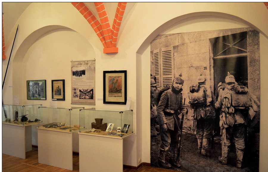
Ryc. 10. Wystawa I wojna światowa 1914-1918 poświęcona 100-leciu wybuchu I wojny światowej.