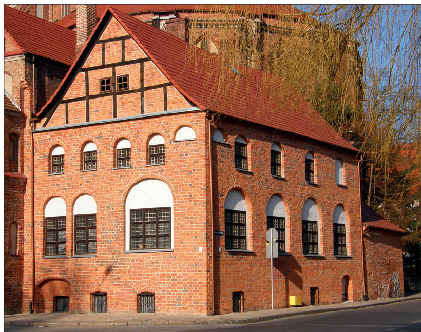
Ryc. 4. Budynek plebanii kościoła Mariackiego przy ul. Bolesława Krzywoustego w Stargardzie po zakończeniu prac remontowych, wg stanu z 11 marca 2014 r.