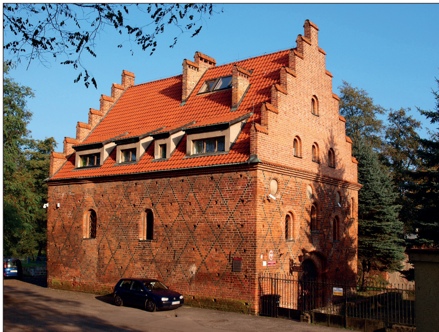
Ryc. 5. Arsenal/zbrojownia z około 1500 r. przy ul. Basztowej w Stargardzie (obecnie siedziba Archiwum Państwowego w Szczecinie Oddział w Stargardzie), wg stanu z 30 października 2014 r.