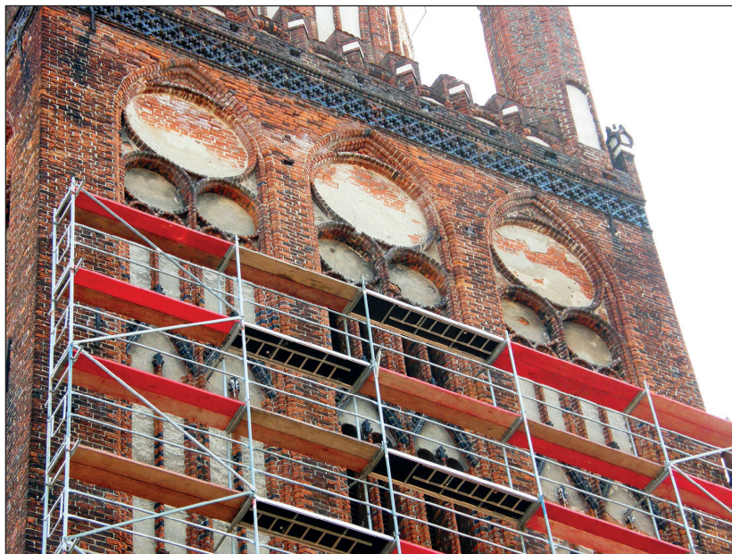
Ryc. 3. Fragment zachodniej fasady wieży północnej kościoła Mariackiego w Stargardzie w trakcie prac renowacyjnych, wg stanu z 11 marca 2014 r.